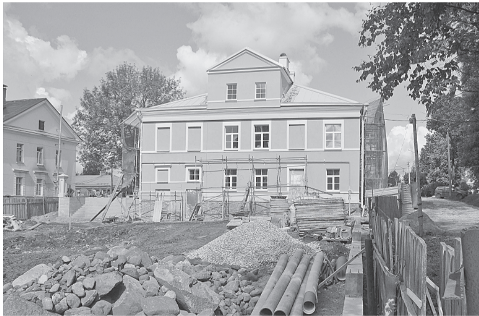
Обособняк купца Митрофанова — вид со двора