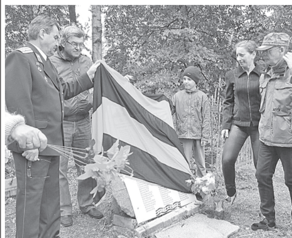
На открытии памятного знака в Опеченском Посаде