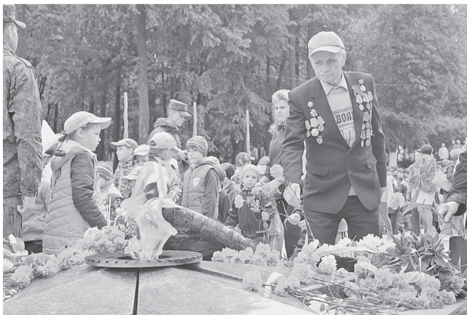
Алые звезды — погибшим за Родину

У мемориала «Вечный огонь» состоялся торжественный митинг, посвящённый Дню памяти и скорби.