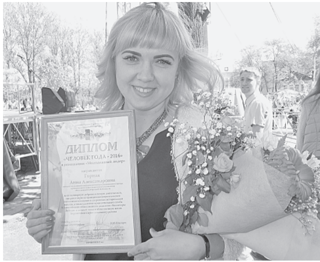
На празднике «День города» наградили лучших